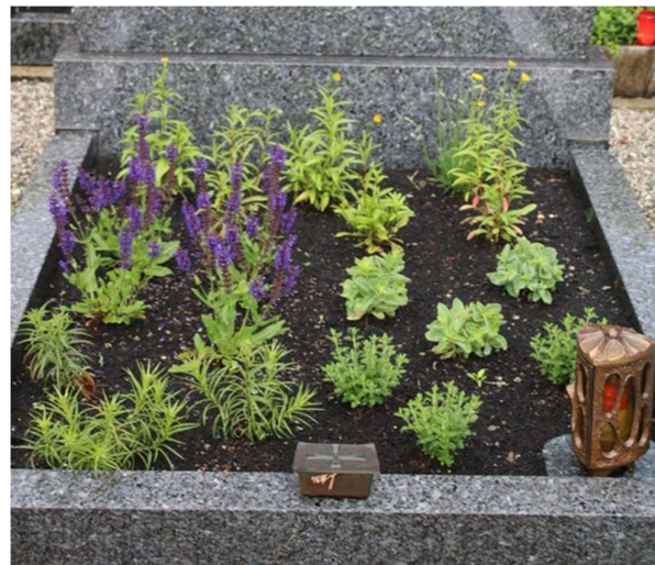
Beet im Frühjahr

Sabine Kirchner hat für „Grafing summt“ dieses Jahr einen ersten Test für eine „bienenfreundliche Grabgestaltung“ gemacht. Pflegeleicht sollte es sein und mit blühenden Pflanzen von April bis Oktober. Trotz des trockenen Sommers musste das Grab an einem vollsonnigen Standort nicht gegossen werden – also ein runder Erfolg.