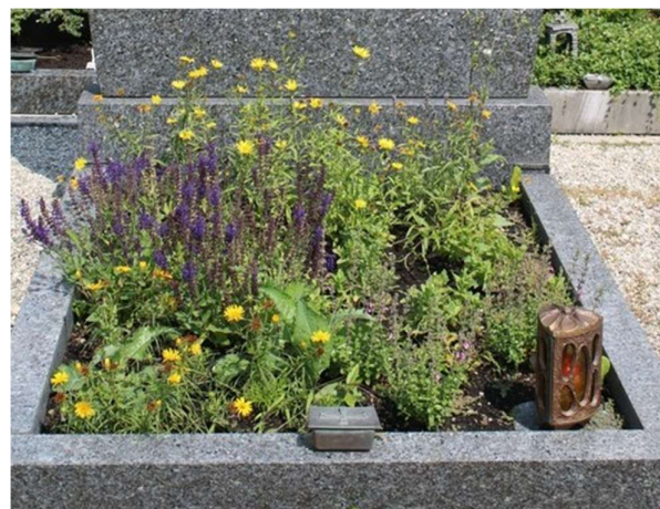
Beet im Sommer

Sabine Kirchner hat für „Grafing summt“ dieses Jahr einen ersten Test für eine „bienenfreundliche Grabgestaltung“ gemacht. Pflegeleicht sollte es sein und mit blühenden Pflanzen von April bis Oktober. Trotz des trockenen Sommers musste das Grab an einem vollsonnigen Standort nicht gegossen werden – also ein runder Erfolg.